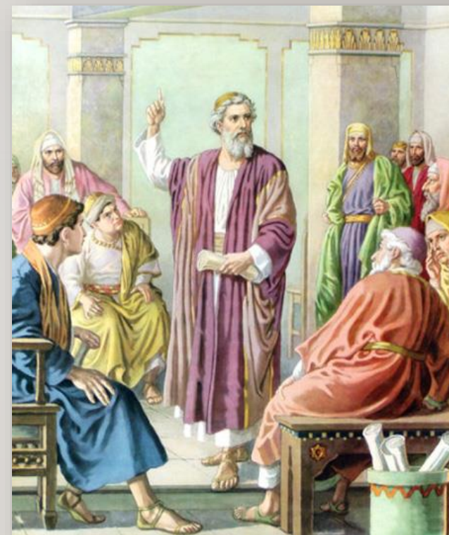
Gamaliel Starszy (I w. p.n.e./I w. n.e.) – faryzeusz, członek Sanhedrynu, szanowany przez cały naród uczonej w Prawie, nauczyciel Pawła z Tarsu,

Został wysłuchany i w efekcie apostołów ubiczowano (za nie dostosowanie się do zakazu głoszenia) i wypuszczona